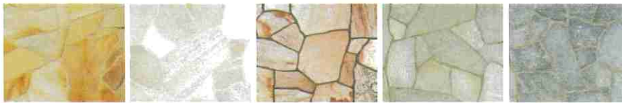
ラスティックイエロー